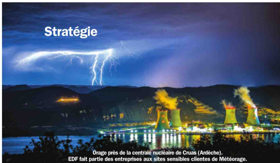
Orage près de la centrale nucléaire de Cruas (Ardèche). EDF fait partie des entreprises aux sites sensibles clientes de Météorage.