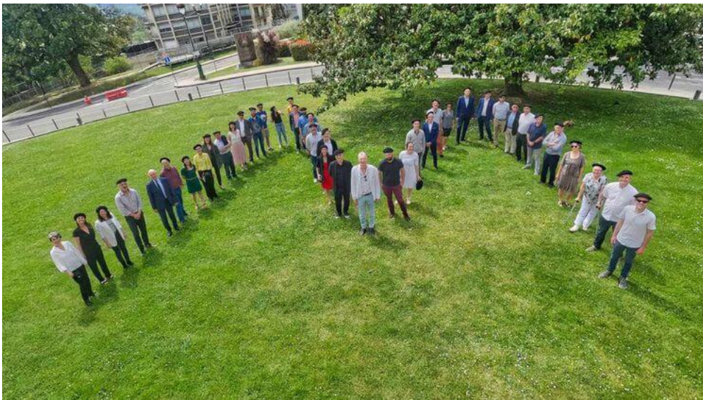
L'équipe de Météorage et ses partenaires rassemblés pour fêter les 35 ans d'existence de l'entreprise.